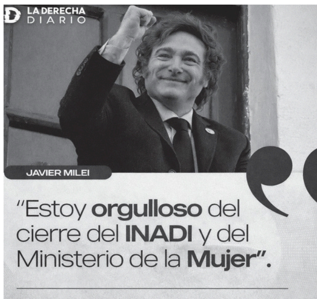
Figura 3. LDD celebra en X el cierre del INADI

Una de las primeras acciones de Milei en el gobierno fue intentar cerrar el Instituto contra la Discriminación la Xenofobia y el Racismo (INADI), lo que pudo concretar recién un año después, debido a trabas administrativas porque la Argentina tiene una Ley Antidiscriminatoria que está vigente y que fue el marco de la creación de ese instituto, lo que el gobierno quiso ignorar en un primer momento. LDD celebró la medida